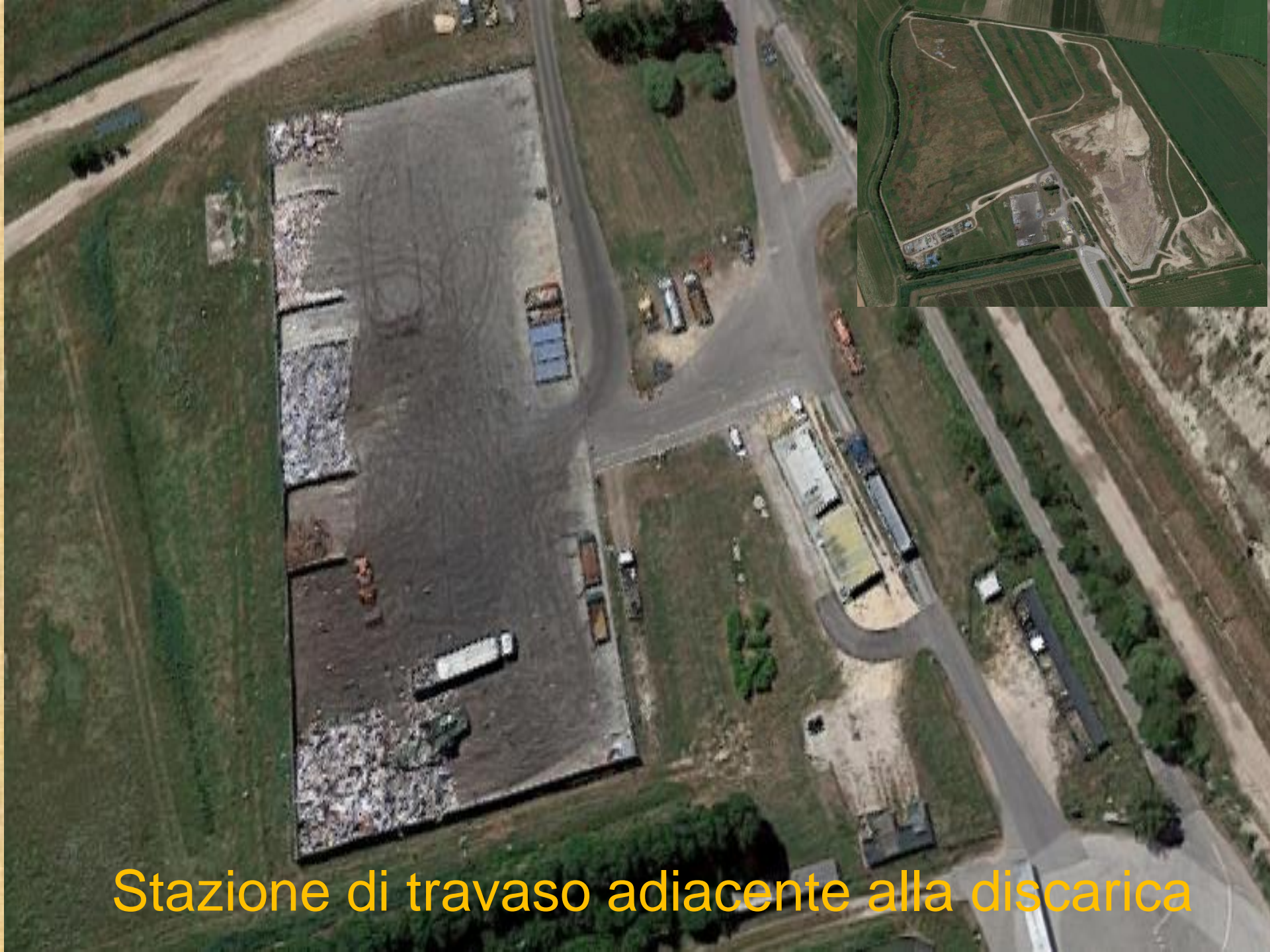
Stazione di travaso adiacente alla discarica