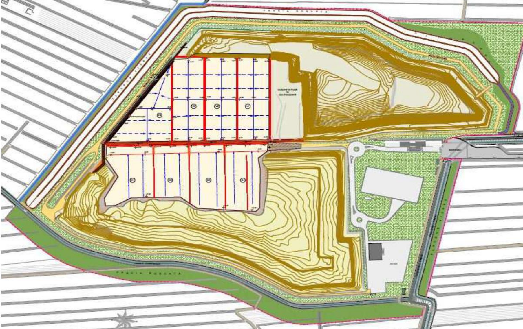
Morfologia del fondo discarica