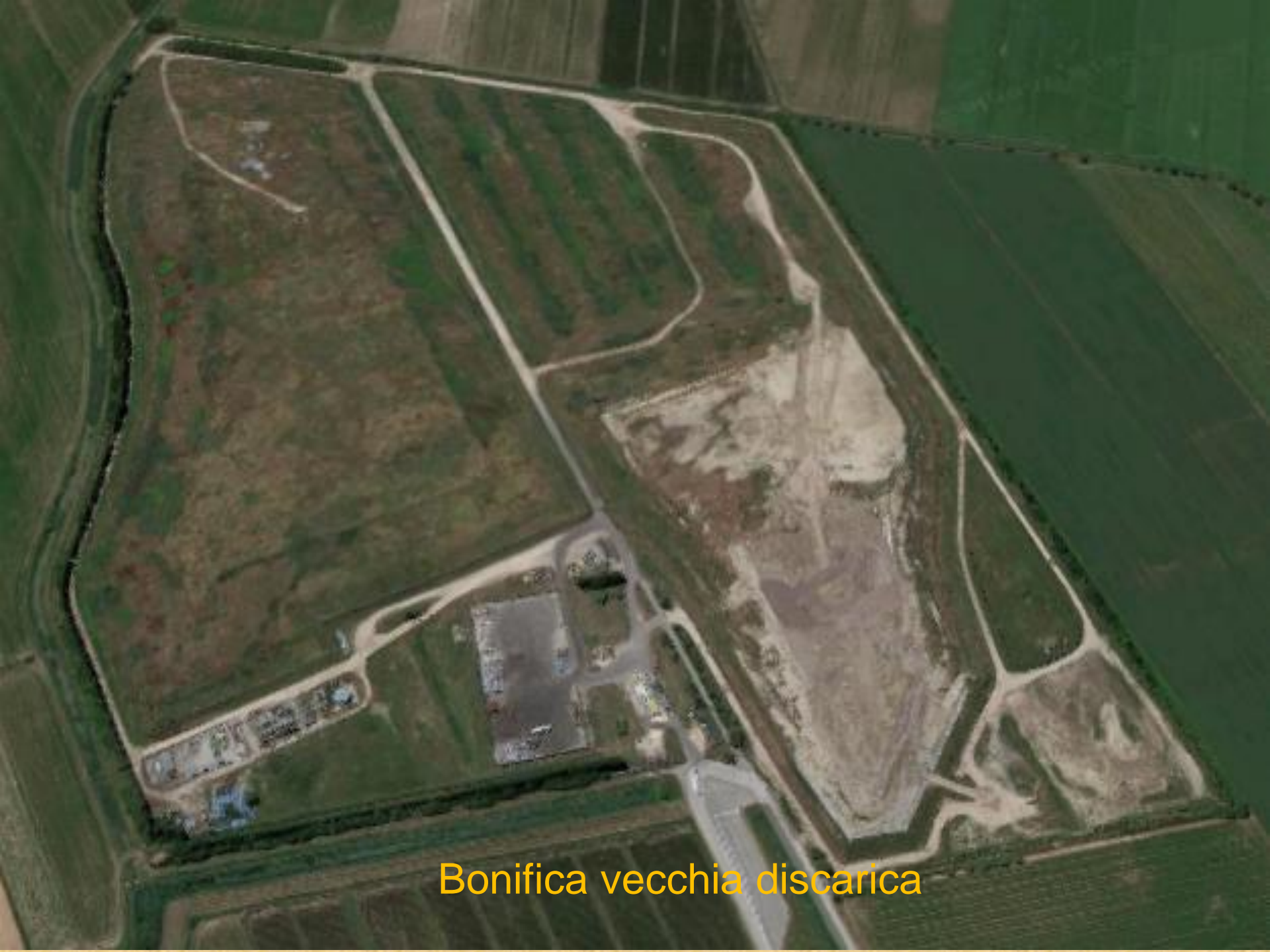
Bonifica vecchia discarica