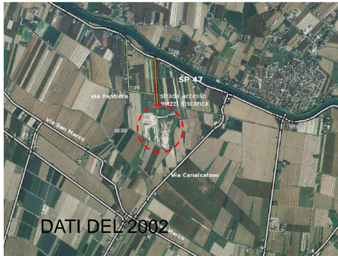
Figura 4-17 Inquadramento viario (Elaborazione TERRA SRL)

Nella figura che segue sono riportate le principali infrastrutture di accesso alla discarica Piave Nuovo.