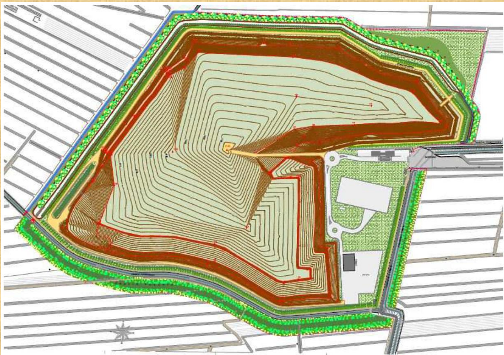
Sistemazione Finale della Discarica